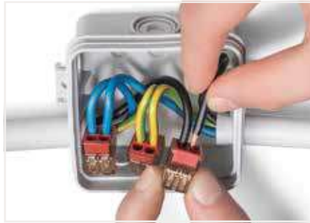
連接方式：將剝去絕緣外皮的單芯導線插入到底。