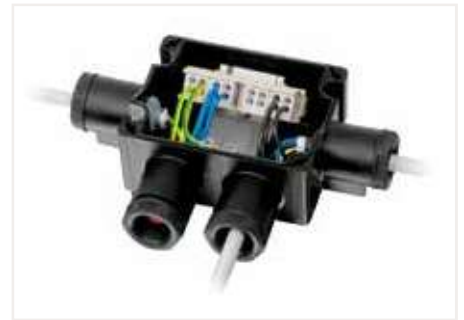
Ex 接線盒中的接線示例