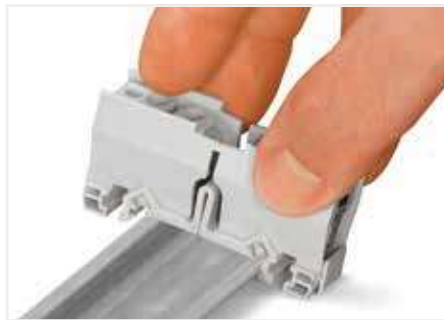
將安裝支架卡入軌道。