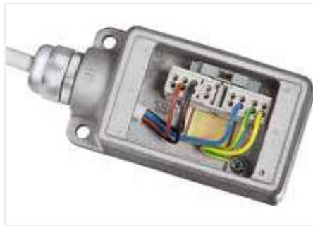
Ex 接線盒中的接線示例