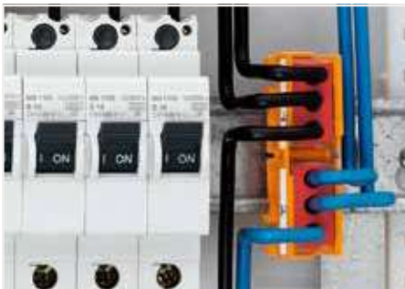
安裝支架（請參閱附件）適合必須標記連接器並將其固定到位的應用。DIN-35 軌道式支架最多可容納六個連接器，也可以使用兩個螺絲將其安裝在平面上。使用連接器支架，可以在配電箱或接線盒中執行各種接線應用。譬如：電位倍增和改變導線尺寸至 6 mm 2 (10 AWG)...等等。