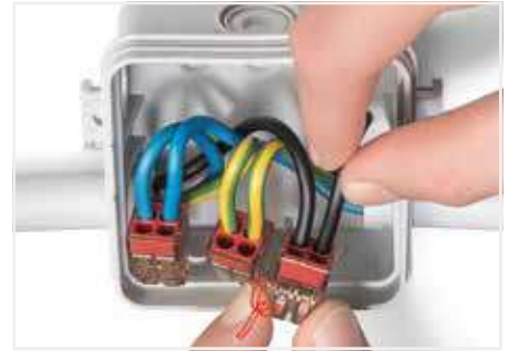
拆卸：透過左右轉動連接器即可將導線拔出。