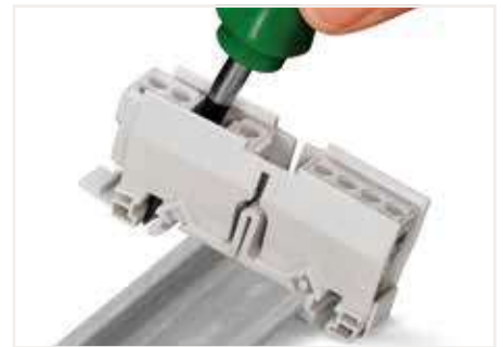
從軌道上卸下安裝支架。